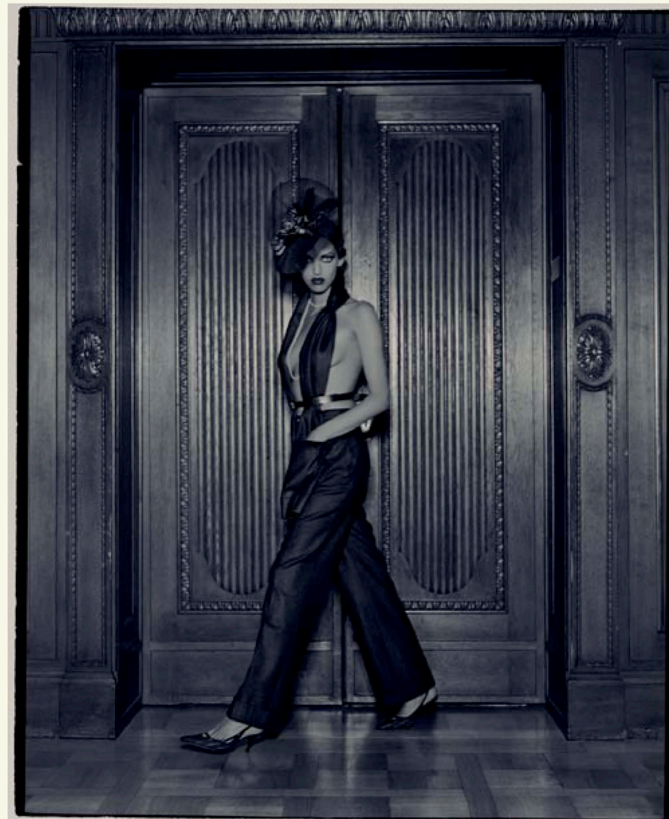
Aus Werner Pawloks Serie »Hommage an Helmut Newton«. Fotografiert 2004 in einer Berliner Freimaurer-Loge

PAWLOK: Nein, von bestimmten Feinpapieren mit faszinierender Oberflächenprägung. Sie wissen, mein Leben ist die Fotografie und wenn ich für ein bestimmtes Motiv mir ein bestimmtes Papier vorstelle dann kann es sein, dass ich das auch mit größtem Zeitaufwand realisiere. Es ist noch zu früh bereits jetzt ins Detail zu gehen: Ich experimentiere damit, unbeschichtete Papiere für den Pigmentdruck speziell zu präparieren. Mit den Emulsionen von Polaroid habe ich vergleichbar gearbeitet. Bei diesen Experimenten gilt für mich, dass all diese technischen Experimente spielerisch ablaufen. Wenn ich merke, dass ich verkrampe, dann höre ich auf.