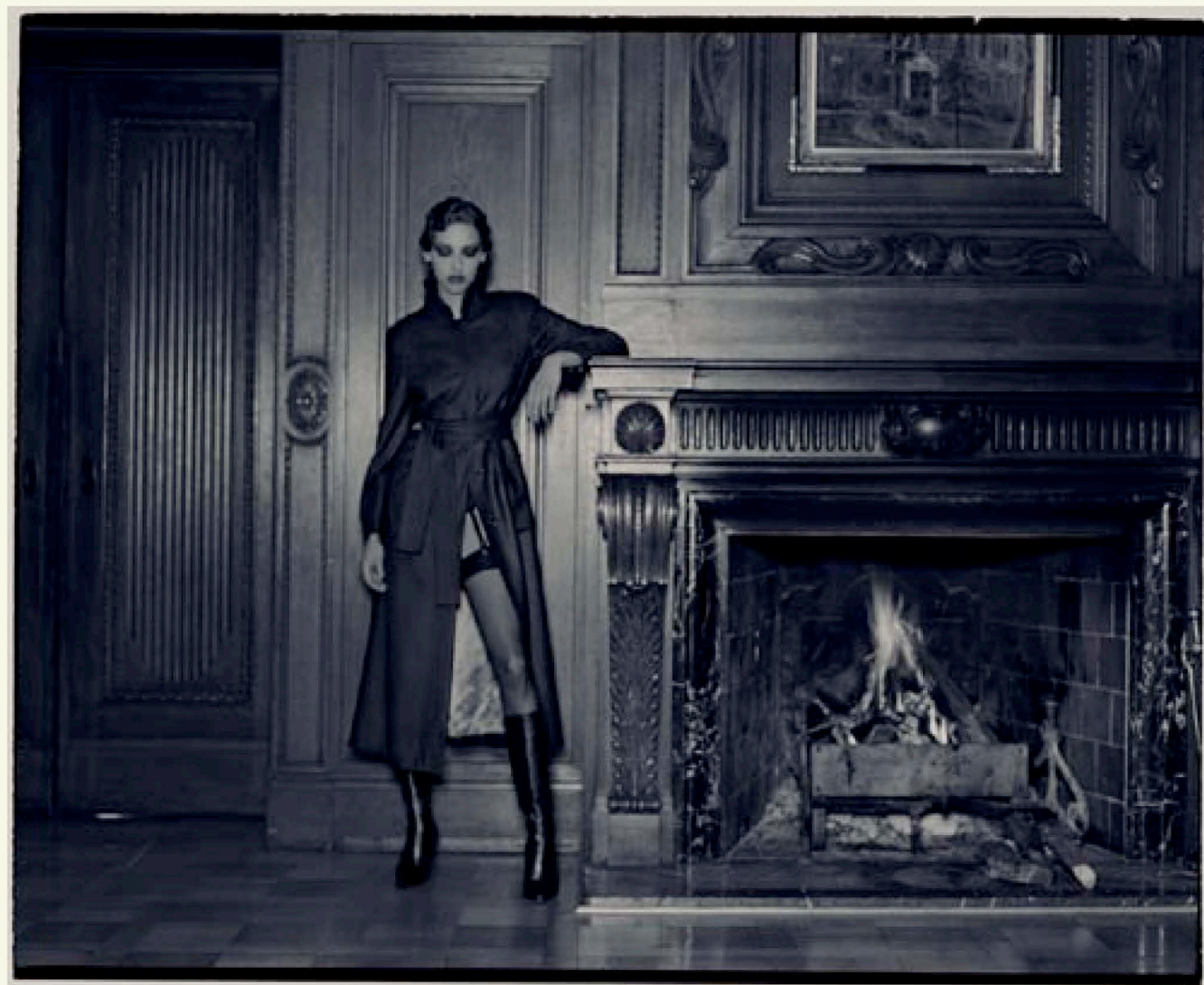
Aus Werner Pawloks Serie »Hommage an Helmut Newton«. Fotografiert 2004 in einer Berliner Freimaurer-Loge

Welches Ziel verfolgt ein international erfolgreicher Fotograf wie Werner Pawlok, wenn er sich einen Großformatdrucker in das Studio stellt? Über seine Erfahrungen referierte Pawlok bei einer Veranstaltung des adf (Arbeitskreis digitale Fotografie). Hermann Will interviewte Pawlok in seinem Stuttgarter Studio.