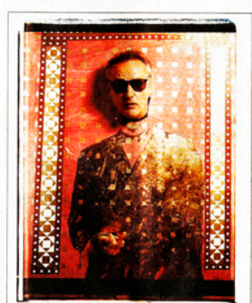
Porträt Dennis Hopper, aus der Serie „Stars and Paints“, 1992