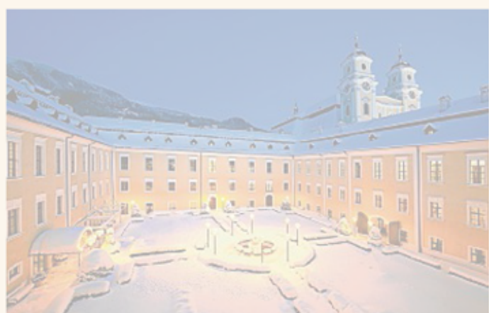
Das ehemalige Benediktinerkloster Romantik Schloss Hotel Mondsee im Salzkammergut – edel, fein und luxuriös!