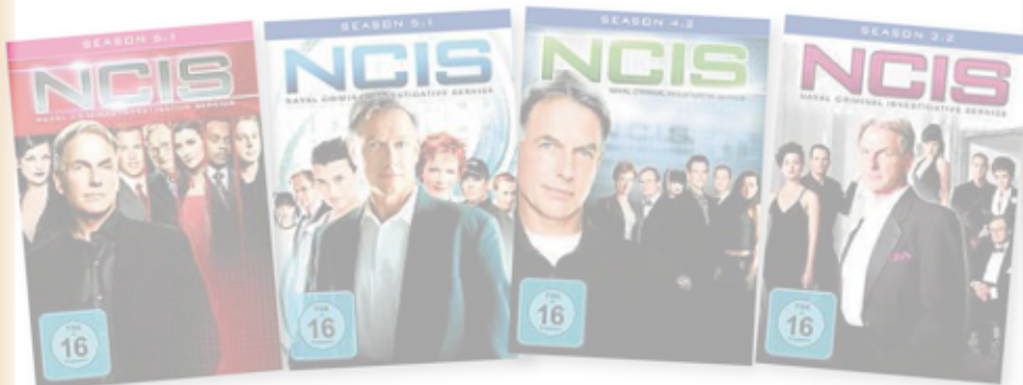
Navy CIS – der US-Serienknüller als exklusive Programmierung am 24. Dezember auf 13th Street Universal

Mehr Infos: www.entertain.de Preis: Gewinnen Sie eines von zwei Smartphone Samsung Galaxy S3 LTE oder 4 Staffeln Navy CIS. Heute SMS mit tz win entertain an die 52020.*