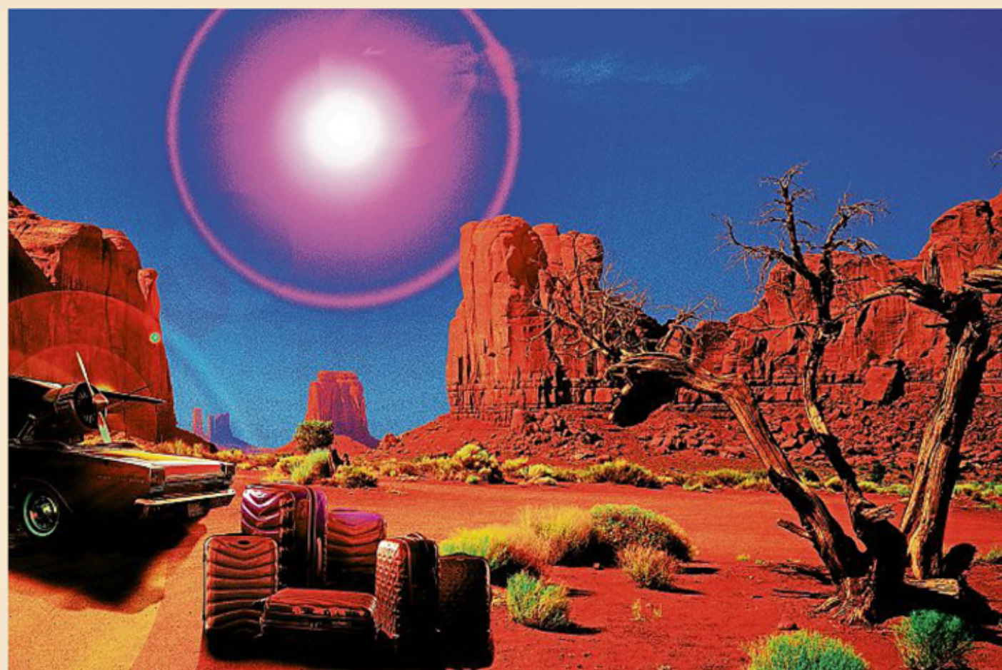
Werner Pawlok fotografierte „Trip to Monument Valley“. Zum Gewinn des Koffer-Sets heute SMS mit tz win pawlok an die 52020*