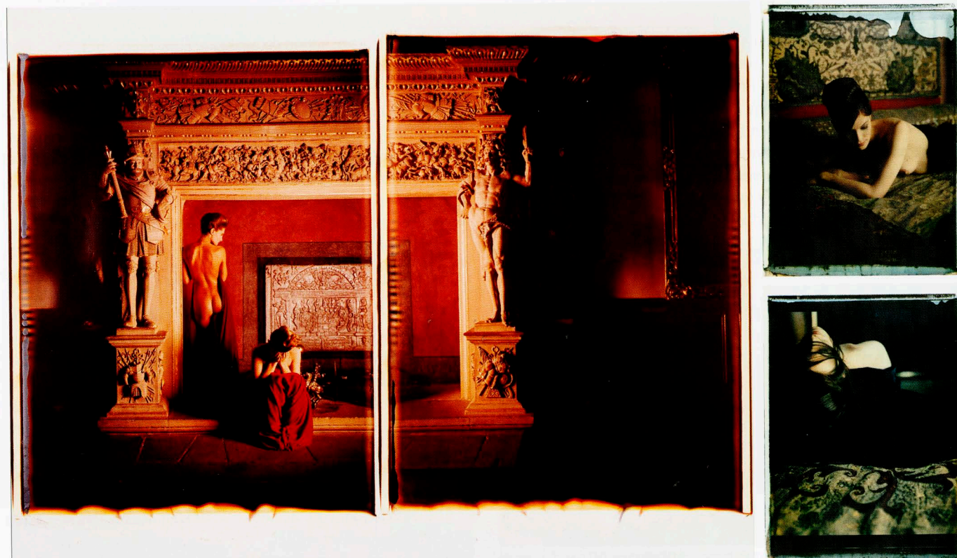
Pawloks Polaroid-Transfer-Serie „Photography Paintings“ ist Teil seiner Lumas-Edition (im Uhrzeigersinn): Kaminzimmer, Nora II, Nora I.

digit! Wie halten Sie es mit der Balance zwischen freien und Auftragsarbeiten?