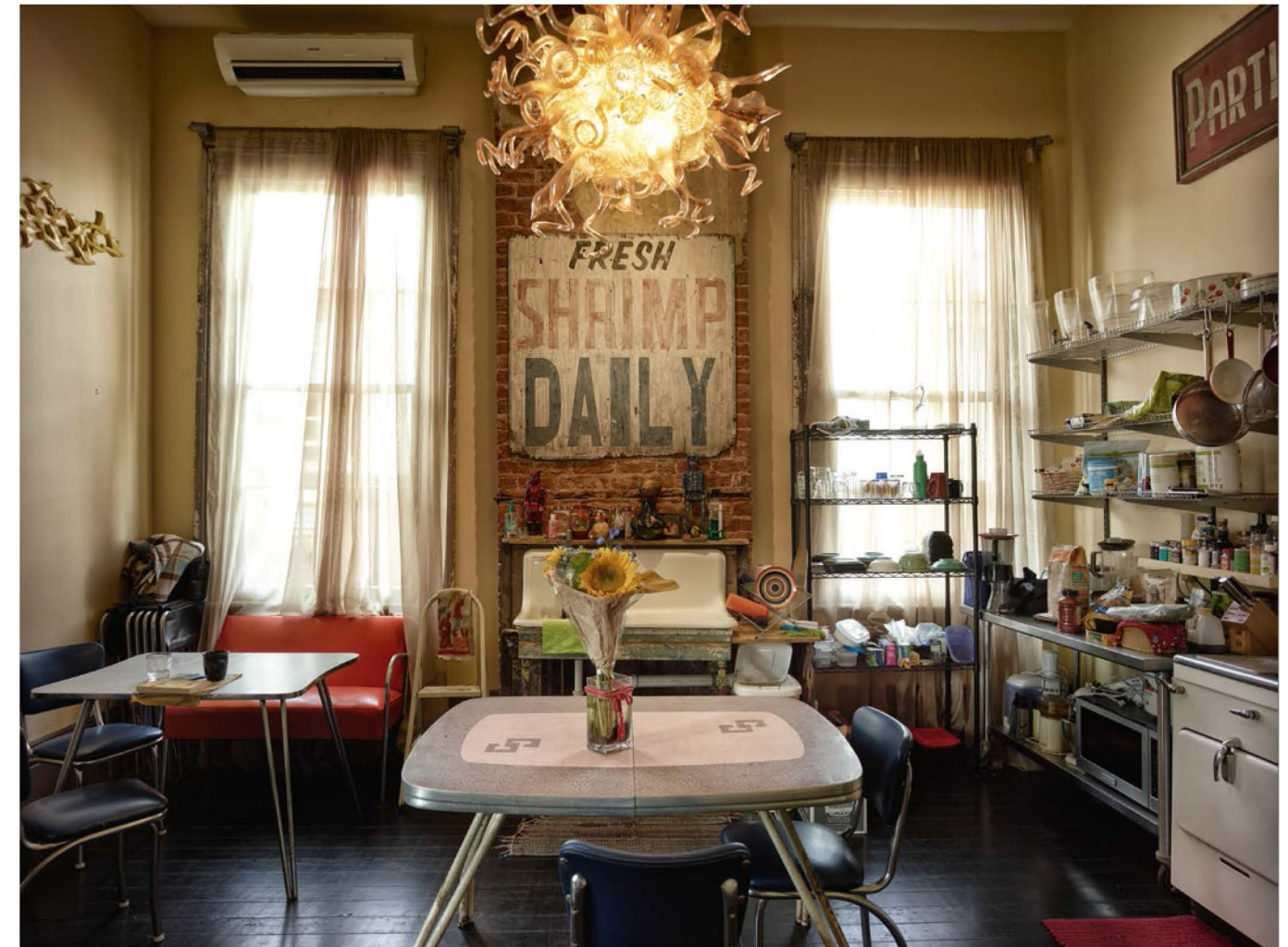
Motiv aus Pawloks neuer Serie ‚New Orleans – undercurrent‘, die ebenfalls bei Lumas erscheint.

Der einzige Nachteil ist vielleicht die Tatsache, dass ich, weil ‚Cuba – expired‘ so erfolgreich ist, vorwiegend als ‚Kuba-Fotograf‘ wahrgenommen werde. Das ist manchmal lästig, weil man in einer