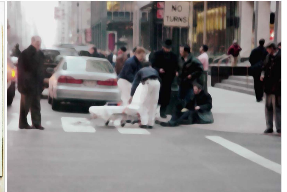
Pawloks Werk ist äußerst vielschichtig (v.l.): Girardi II, aus der in Polaroid-Transfertechnik entstandenen Serie „Photography Paintings“, „Accident“ aus der Serie „Moving Cities“.