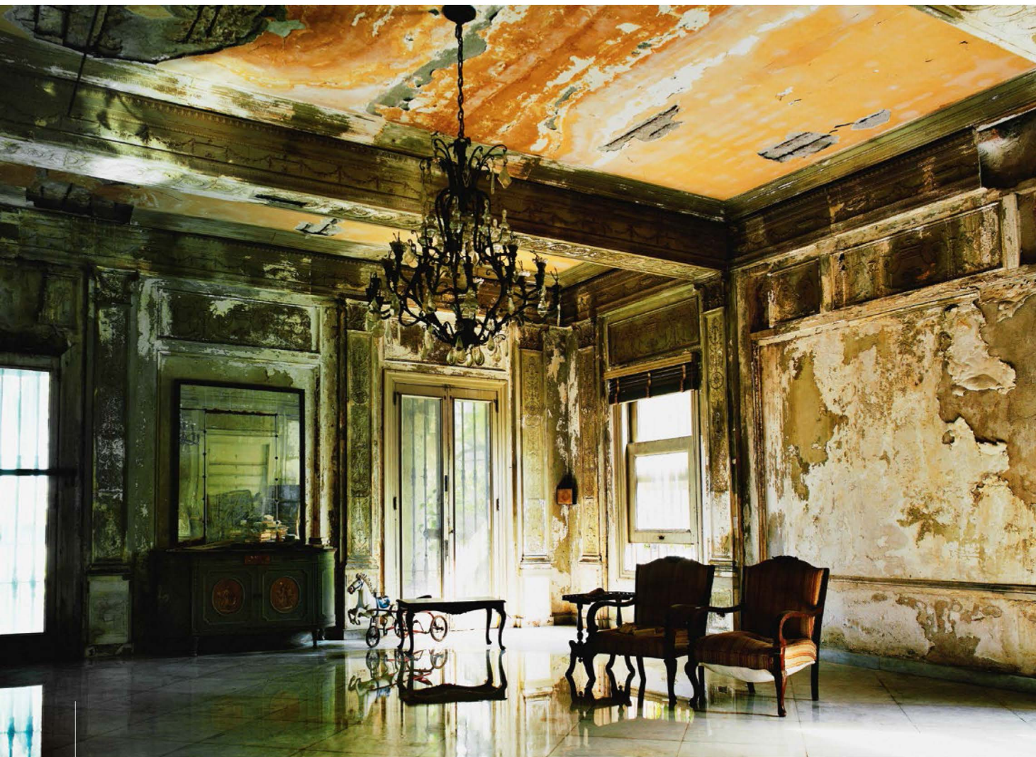
„House of Luisa Faxas“. Die Serie „Cuba – expired“ war Pawloks Debüt bei Lumas – und sofort ein Erfolg.

Für Fotokünstler ist der Vertrieb der eigenen Bilder als Editionsprints der letzte, entscheidende Schritt der Vermarktungskette. Wir stellen zwei Best-Practice-Beispiele vor.