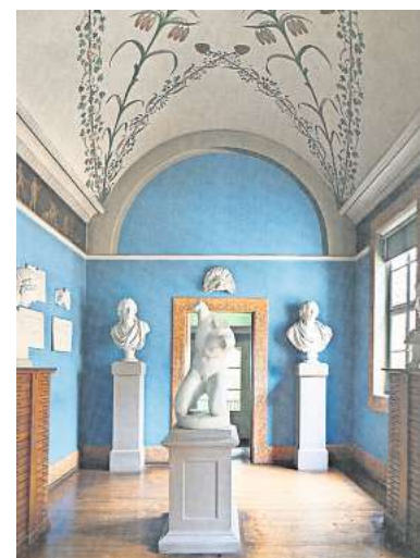
Das Büstenzimmer hat ausgesprochen viel originale Substanz bewahrt.