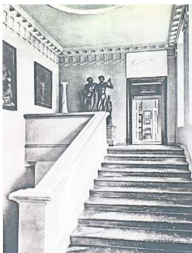
Das Treppenhaus anno 1915.