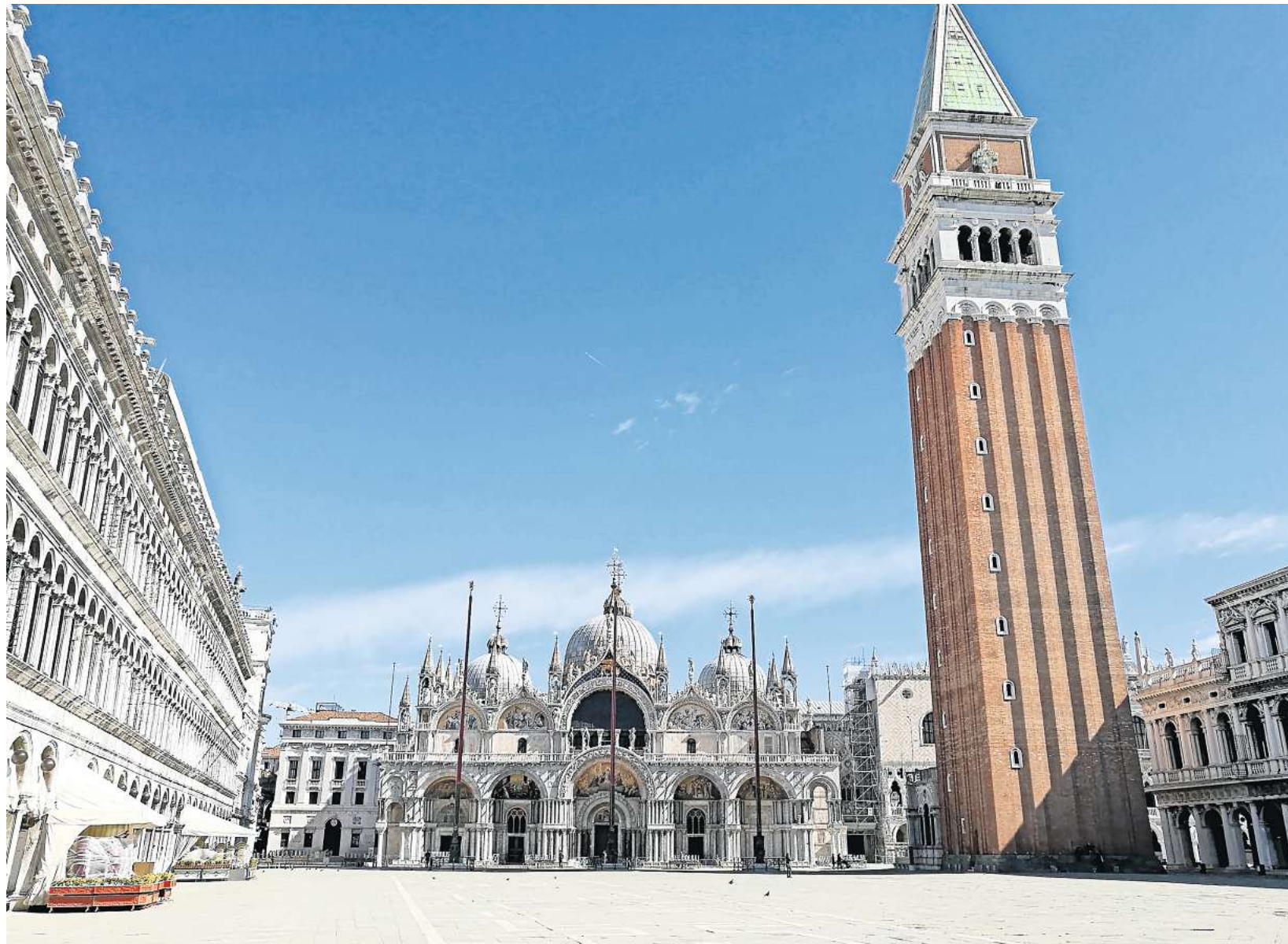
Der Markusplatz in Venedig ohne Touristen.